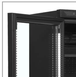
Luz LED en interior de marco de puerta

La gama CEV está disponible en opciones de color blanco o negro, con puerta con bisagra a la derecha o a la izquierda, con o sin marquesina. A petición y por un coste adicional, este producto también está disponible con una clasificación energética C. Contacte con nuestro equipo de ventas para obtener más información.